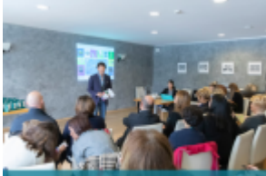
cosmesi@pro Il mondo della cosmesi incontra i consumatori