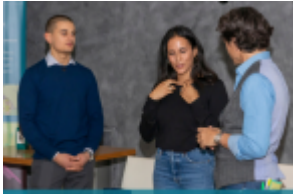
cosmesi@pro Il mondo della cosmesi incontra i consumatori