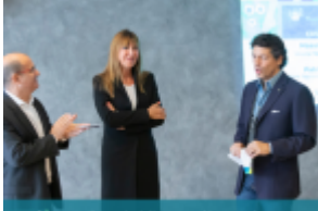
cosmesi@pro Il mondo della cosmesi incontra i consumatori