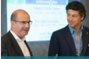
cosmesi@pro Il mondo della cosmesi incontra i consumatori