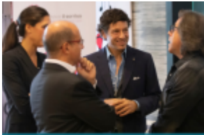
cosmesi@pro Il mondo della cosmesi incontra i consumatori