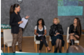
cosmesi@pro Il mondo della cosmesi incontra i consumatori