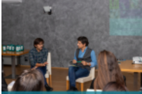
cosmesi@pro Il mondo della cosmesi incontra i consumatori