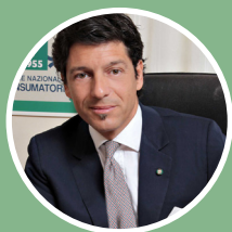
AVV. MASSIMILIANO DONA PRESIDENTE UNIONE NAZIONALE CONSUMATORI

Ecco perché è importante conoscere questi prodotti , sapere come vengono realizzati, quali sono le loro caratteristiche e le loro qualità. Ne è convinta l' Unione Nazionale Consumatori che, in collaborazione con Integratori Italia , da anni promuove una serie di iniziative per fornire ai cittadini le giuste informazioni sul corretto utilizzo degli integratori.